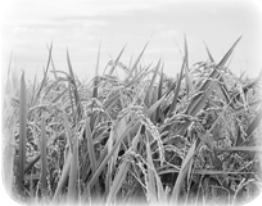
▲収穫間近のななつぼし

岩見沢市は、人口約9万人の空知地方の中心都市です。主要な産業は農業で、主に米、小麦、玉ネギなどが栽培されています。特に米は道内一の作付面積と収穫量(平成25年度)を誇っています。代表的な品種である「ななつぼし」は岩見沢市生まれ。つや、粘り、甘みのバランスが抜群で、国内の代表的な銘柄と並ぶ最高ランクの評価を得ています(平成25年度)。