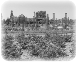
◀いわみざわ公園のバラ園

岩見沢の「市の花」は、白石区と同じ「バラ」。観光地として知られるいわみざわ公園にはバラ園があり、約4万㎡の敷地に約490品種・2,600株のバラが植えられています。7月下旬から見頃を迎え、多くの方が訪れます。