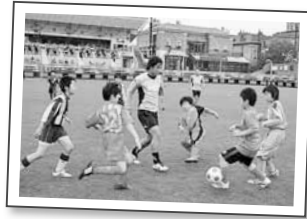
▲西町地区で開催されたコンサドーレ札幌の選手によるサッカー教室

除排雪への理解度向上を目指す「地域と創る冬みち事業」、幹線道路の歩道美化を行う「西区花とみどりの回廊づくり」などを、地域住民や企業との協働で行います。