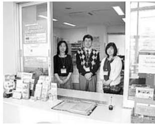
まちづくりセンター事務室

1階には、まちづくりセンターのほか、イベントなどを行う多目的室やサロンがあります。2階には読書カウンターを設置したラウンジなどがあります。