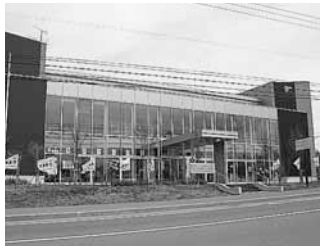
里塚・美しが丘地区センター

業務時間 8時45分～17時15分 ※土・日曜、祝・休日および12月29日～1月3日を除く。 所在地 里塚2条5丁目1-1(里塚・美しが丘地区センター内) ☎884-1210