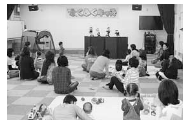
▲普段のふくふくキッズの様子。他の地区に住んでいる親子が遊びに来ることもあるとか。