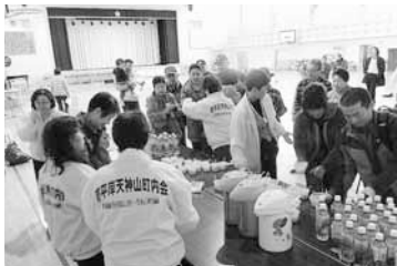
▲平岸西小で行われた避難所開設研修。避難スペースの決定、生活班の編成、非常食の試食などを通して、実際の避難所のイメージをつかみました。