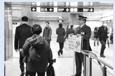
▲エスカレーターの歩行禁止を呼び掛ける職員(平成26年4月)