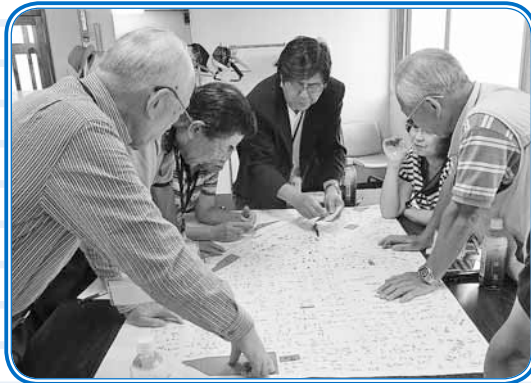
◀DIG実施時の様子 (平成25年7月25日)