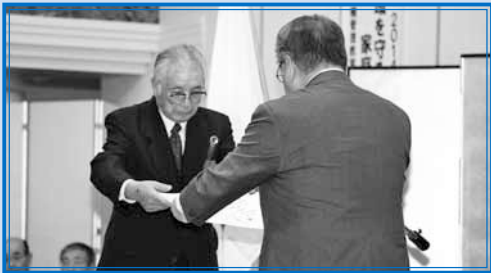
◀授賞式では上田市長から表彰状が授与されました

発寒北連合町内会が、住民の相互協力による自主防災活動において顕著な功績があると認められ、平成26年1月22日に札幌市防災表彰を受賞しました。