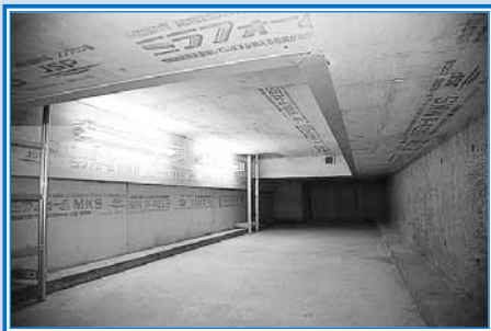
◀集会室のステージ下に設置された備蓄庫

老朽化に伴い改築工事を行っていた西町会館（西町南9）が完成しました。西町まちづくりセンターと福祉のまち推進センター、おとしより憩の家が併設された会館には、備蓄庫が設置されています。