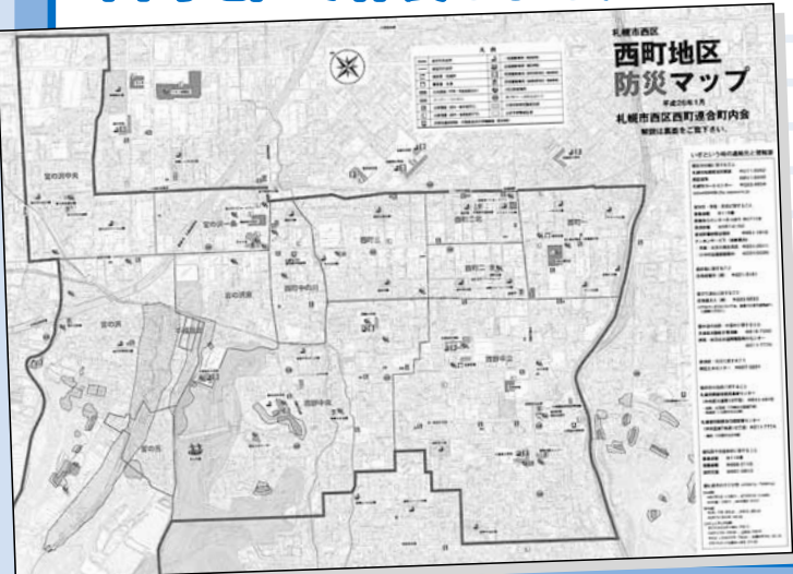
▲西町連合町内会が作製した『西町地区防災マップ』

今までも各单位町内会での防災マップはありましたが、災害は広範囲にわたる可能性が高いため、連合町内会での作製を決めました。特徴は避難するための情報に特化して記載した点、高齢者にも見やすいことを心掛けた点です。防災マップは全戸に配布して、防災訓練などでの活用を予定しています。