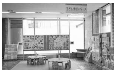
▲広聴係(0番窓口)前にあります

区役所1階ロビーにも児童会館、幼稚園、子育てサロンや子育てボランティアの活動状況などの情報を発信するコーナーがあります。ぜひお立ち寄りください!