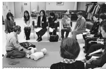
◀研修交流会の様子

登録された方には、年間予定表やボランティア通信などで活動の機会や研修会などをご案内し、都合や興味、関心、特技などに合わせて、ご自分で活動を選んでいただきます。できるときに、できることを末永く！活動してみませんか。