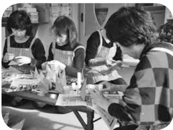
▲クリスマス会のおもちゃづくり ▲健診の待ち時間に絵本の読み聞かせ

地域や児童会館子育てサロンでの親子との交流や、子育て講座などの際の託児、区が実施する行事のスタッフ、絵本の読み聞かせなどさまざまな活動をしています。