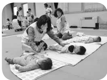
▲子育て講座中の託児