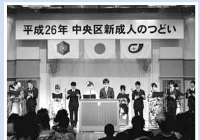
▲中央区では1,997人が大人の仲間入り