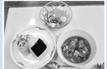
▲この日の献立は「カラフルおにぎり」「だいずとキャベツのトマトスープ」「フルーツ白玉」