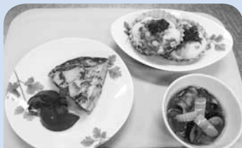
1人分：509kcal、塩分2.6g おすすめの組み合わせ例 ・オムレツ(主菜) ・ミネストローネ(副菜)

い。お好みの具でもお試しください。計量や洗い物が少なく、休日にお子さんとするのも楽しいですよ。ハムやチーズなど、要がないため簡単ですよ。材料を混ぜて具を載せて焼くだけ！焼きたてパンケーキが手早くできます。