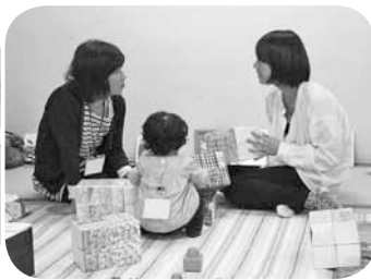
▲子育てサロンで親子と交流