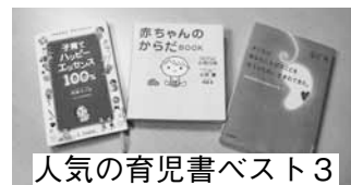
人気の育児書ベスト3