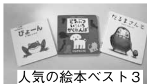
人気の絵本ベスト3