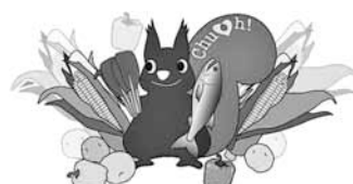
▲中央区食育マスコット「モリス」

しまししょう。食べ物のカロリー。 食べ物のカロリー。 2月24日(月)13時30分～15時30分(受け付けは13時15分から)。 ▽会場 中央保健センター2階講堂(南3西11)。 ▽対象 区内在住の方。 ▽定員・費用 20人・無料。 ▽持ち物 筆記用具、電卓。 ▽申込 2月13日(木)9時から電話で(ファクス不可)。先着順。 (申込詳細) 健康・子ども課 健康やか推進係 ☎(511) 7223