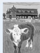
作家名：一木万寿三 作品名：ヘレフォード(1955年頃制作)

日所 2/22(土)〜4/13(日)。 ¥500円。高校生・大学生250円、小中学生無料。 所 芸術の森美術館(591-0090(南区芸術の森2))