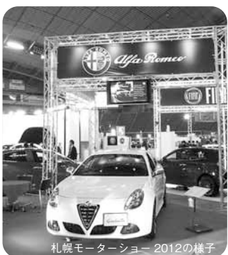
札幌モーターショー 2012の様子

と白石駅は5月〜6月のみ。 申 込、FAX、E。上欄必要事項と希望駅、希望月を記入し、2月28日(金)(必着)まで。(抽選) 間 市コールセンター(222)4894