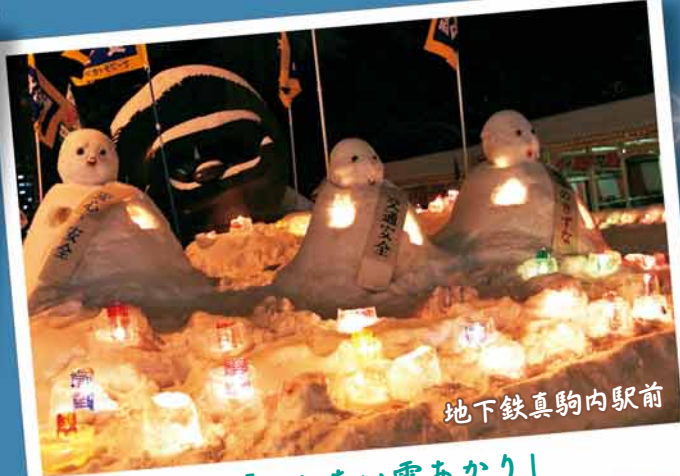
地下鉄真駒内駅前