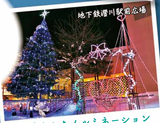
地下鉄澄川駅前広場

南区では、住民の手でアイスクャンدلやスノーキャンدلを地域に飾る「雪あかり」の取り組みが盛んです。やさしく揺れるキャンドルのあかりは、ほっと温かい気持ちにさせてくれます。一緒に作って「お・も・て・な・し」。「まち」と「ひと」の温かさを、あなたも感じてみませんか？