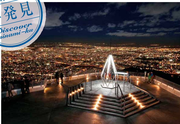
▲山頂展望台から見た札幌の夜景。