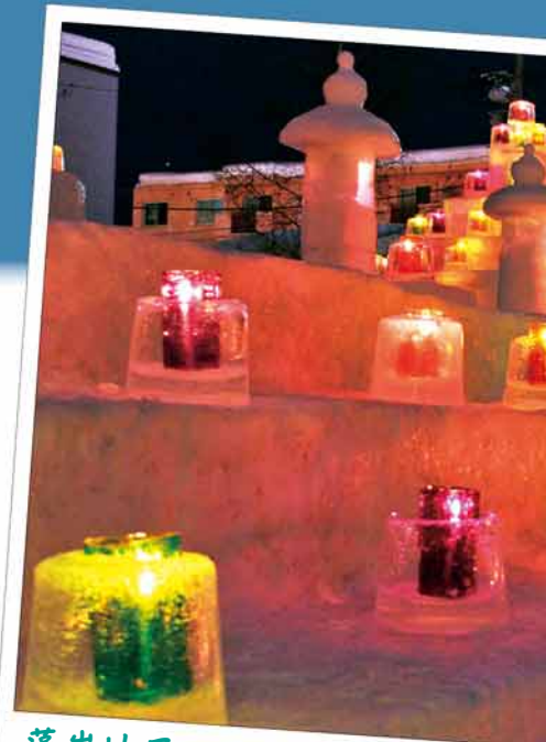
藻岩地区アイスクャンドル

冬の「寒さ」を「楽しさ」に変える雪あかり。ぜひ、皆さんもこの取り組みに参加して、一緒に冬を楽しみましょう。