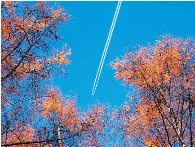
秋晴れの一筋雲 いわがみ けんたろう 健太郎さん(白旗山)