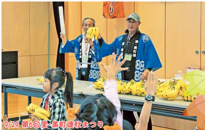
9/29 第6回里・美町連秋まつり

名物のバナナのたたき売りは今年も大人気！ 地域のふれあいと笑顔にあふれるお祭りとなりました。