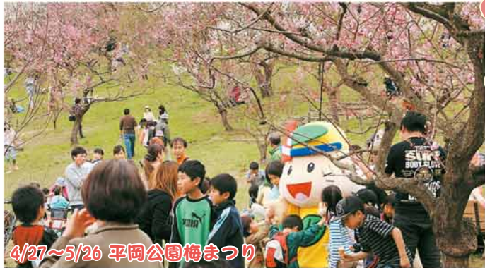
4/27～5/26 平岡公園梅まつり

力を合わせて山の斜面にイラストを彫りました。 ※小規模特認校の入学申込は、本誌30ページをご覧ください。