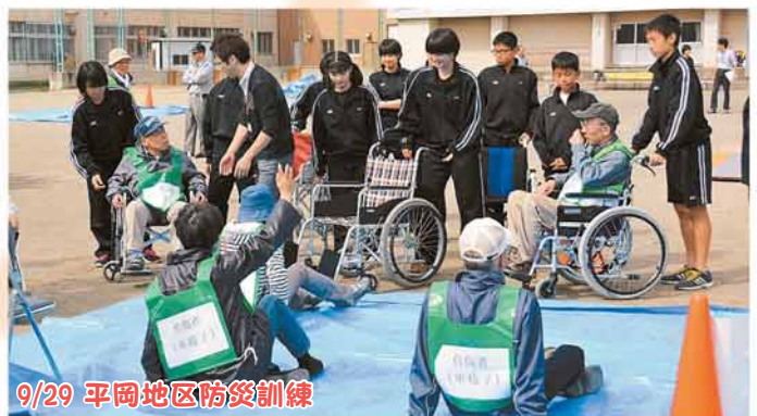
9/29 平岡地区防災訓練

地域住民と平岡中学校の生徒が、合同で訓練。負傷者を車いすで運ぶ方法やバケツリレーのコツなどを学びました。