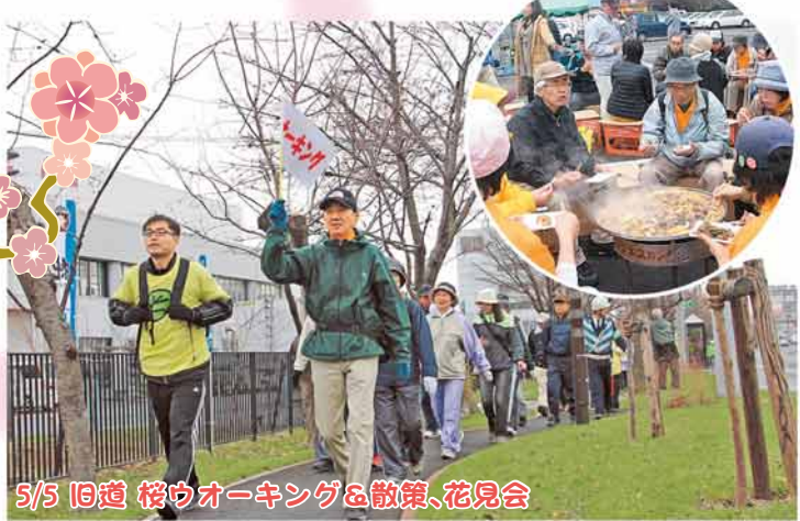
5/5 旧道 桜ウォーキング&散策、花見会

「大きくなって帰ってきてね！」。北野ふれあい橋のたもとで、願いを込めて送り出しました。