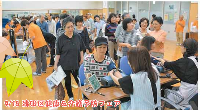
9/18 清田区健康&介護予防フェア

名物のバナナのたたき売りは今年も大人気！ 地域のふれあいと笑顔にあふれるお祭りとなりました。