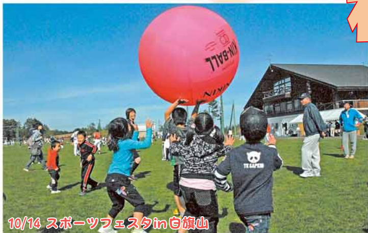
10/14 スポーツフェスタin白旗山