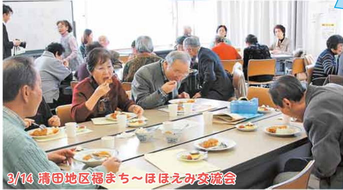
3/14 清田地区福まち～ほほえみ交流会