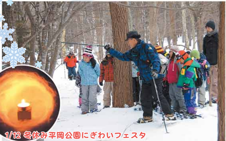
1/12 冬休み平岡公園にぎわいフェスタ