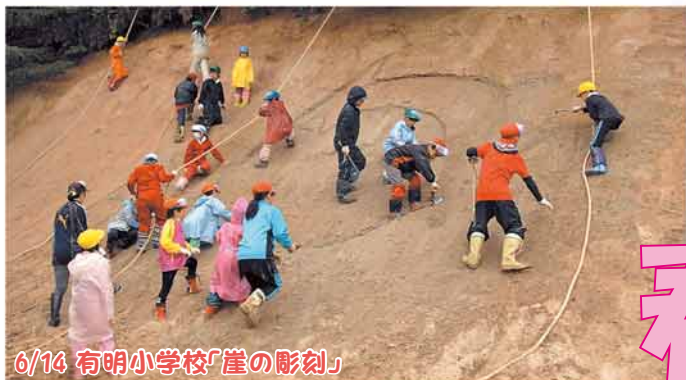
6/14 有明小学校「崖の彫刻」

力を合わせて山の斜面にイラストを彫りました。 ※小規模特認校の入学申込は、本誌30ページをご覧ください。