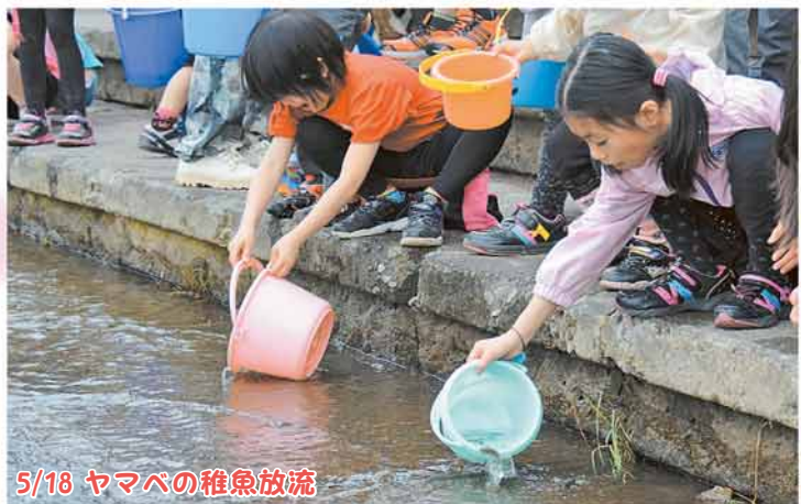
5/18 ヤマベの稚魚放流

梅の花が満開の平岡梅林にきよっちが登場！「きよたでお菓子を食べよう！キャンペーン委員会」の出展もありました。