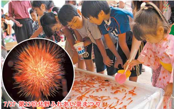
7/27 第23回北野ふれあい夏まつり

たくさんの出店とステージイベントで会場は大盛り上がり。夜空に咲く色とりどりの花火がフィナーレを飾りました。