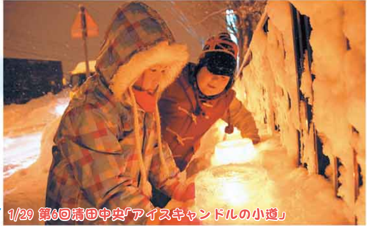
1/29 第6回清田中央「アイスクャンドルの小道」