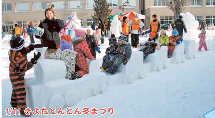
1/11 きよたとん冬まつり