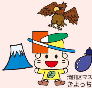
清田区マスコットキャラクター きよっち