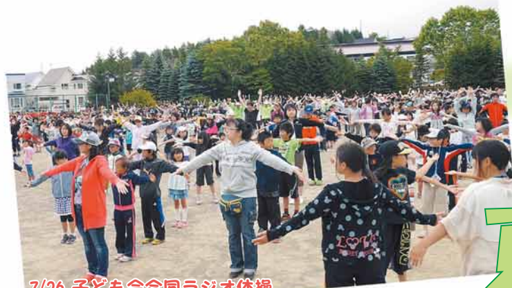
7/26 子ども会合同ラジオ体操

清田中央地区の子どもたちが、夏休み初日の早朝に集合。全員で元気にラジオ体操をしました。