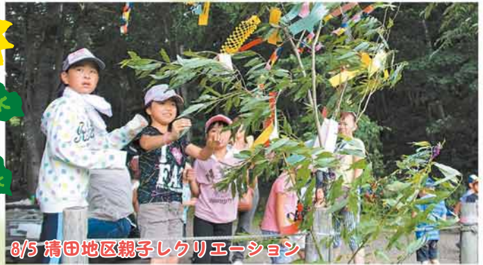
8/5 清田地区親子レクリエーション

たくさんの出店とステージイベントで会場は大盛り上がり。夜空に咲く色とりどりの花火がフィナーレを飾りました。