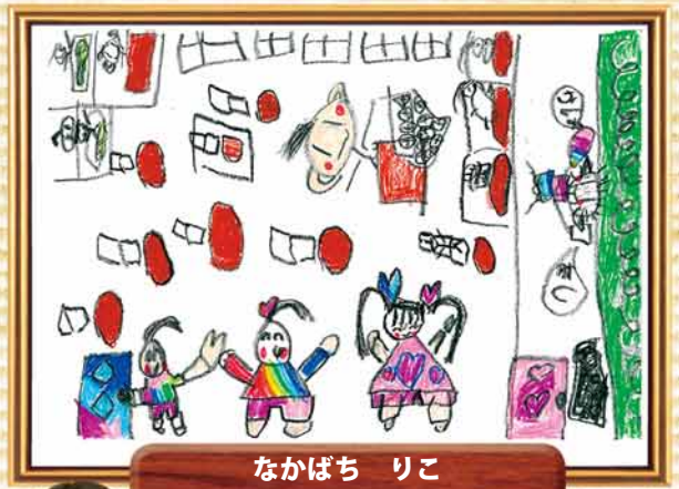
なかばち りこ 題名「教室でお勉強」

画面いっぱいのフィールドで勢いのあるナイスシュートを決めている様子が元気よく描かれていて、とてもわくわくする作品だと思います。