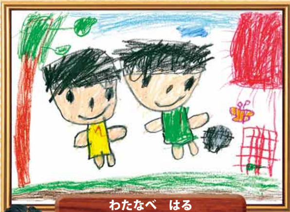
わたなべ はる 題名「サッカーと友だち」

園児が描いた全作品は1月7日(火)～17日(金)まで 区民センター1階ロビーで展示します！