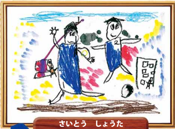
さいとう しょうた 題名「ナイスシュート！」