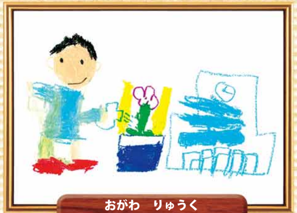
おがわ りゅうく 題名「朝顔を育てたいな」

堂々とした黒い校舎と空の虹の対比がきれいですね。この絵のように大きな子も小さな子も一緒に楽しく過ごしてください。