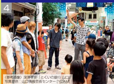
〈参考画像〉深澤孝史「とくいの銀行 山口」