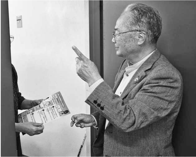
この日の見守り訪問では、高齢者宅を狙った詐欺について注意喚起しました。