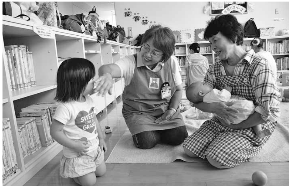
里塚・美しが丘地区センターで行われる子育てサロン「ごまちゃんサロン」の様子。