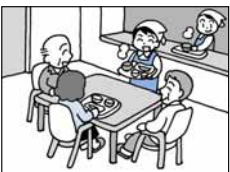
▲短期入所生活介護

このほかにもさまざまな「介護保険サービス」があり、「ケアプラン」に沿って利用します。