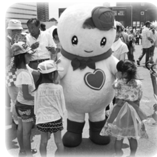
区民に大人気のしろっぴー

着ぐるみの貸し出しは「札幌市が開催する事業」や「白石区内で実施される非営利目的での事業」などに限定されていましたが、10月からは、白石区内外のさまざまなイベントで、しろっぴーの着ぐるみを使用できるようになりました。