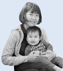
こたに 小谷さん親子

実家が道外なので、親や兄弟に子どもを見てもらうことができません。 急用のときや自分が病気になったとき、どうしたらいいかと心配しています。