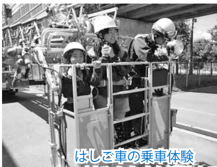
はしご車の乗車体験 (すみかわ少年消防クラブ)

A. 消防車やはしご車などの消防車両の見学、住んでいる地域での防火パトロールや防災訓練、防災マップの作成などを行っています。冬になると消火栓周りの除雪のお手伝いもするなど、安全・安心な暮らしを守るために日々活躍しています。