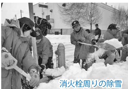
消火栓周りの除雪 (川沿少年消防クラブ)