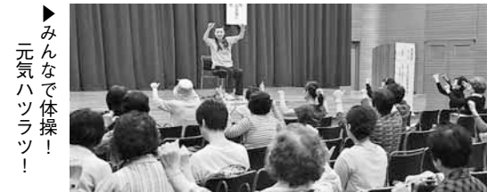
▶みんなで体操! 元気ハツラツ!