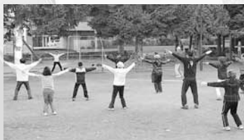
▲毎朝30人ほど参加するラジオ体操

学校が夏休みの期間はもちろん、元旦を除き一年を通じて地区内の公園でラジオ体操を実施しています。この活動は「いつもは来て