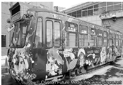
▲昨年の雪ミク電車