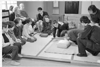
▲心肺蘇生法などの講習会の様子

常時参加しているのは12人前後。月1回の例会で は、新年会やひな祭りなどの季節ごとの行事や、中 央消防署の協力を得て 心肺蘇生法とAEDの 使用方法の講習会を実施したこともあります。 曙町内会の旅行や行事 にもみんな積極的に 参加しています。