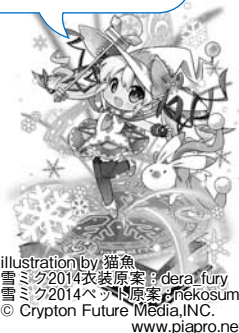
illustration by 猫魚 雪ミク2014衣装原案: dera, fury 雪ミク2014ヘア原案: nekosumi