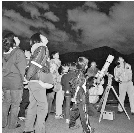
「真砂なす 数なき星の 其の中に 吾に向ひて 光る星あり」(正岡子規)