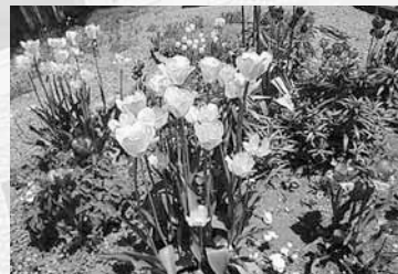
▲バス乗降客からも好評です！

他にもパークゴルフやマーじゃん、歌謡曲愛好会などのさまざまな同好会も活動しています。中でもガーデニングサークル「陽だまり」には、啓明バスターミナルのコミュニティガーデンや公園内の花壇の整備など、きれいなまちづくりに協力してもらっています。