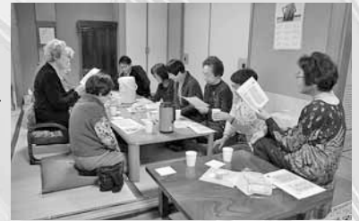
▲お茶を飲みながらの和やかな例会

一番関心があり、毎回話題になるのは防災につ いてです。防災に関 するセミナーを聞き に行くなどして勉強 したり、それぞれが 家庭で備える「自 助」について考え たりすることはもち ろ