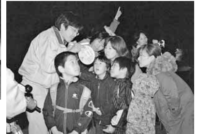
◀みんなの瞳も星の輝き

旭山記念公園(界川4)で開催された「星空観察会」。移動天文車と小型望遠鏡が用意され、雲の合い間から顔をのぞかせる秋の星たちを間近に見た子どもたちは「すごい!」「近くに見えるよ!」と歓声を上げていました。