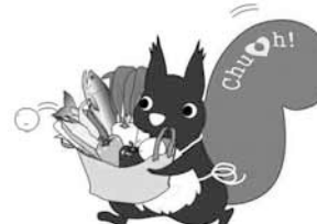
▲中央区食育マスコット「モリス」

▽会場 中央保健センター2階講堂・栄養実習室(南3西11)。 ▽対象 区内在住で、初めてのおせち料理作りに挑戦したい方。 ▽定員・費用 24人・300円。 ※託児はありません。 ▽持ち物 エプロン、三角巾、手拭き、上履き、筆記用具。 ▽申込 11月11日(月)~19日(火)に電話で(ファクス不可)。 申込多数時抽選。結果は11月28日(木)までにはがきで連絡します。 (申込詳細) 市コールセンター ☎(222) 4894(8時~21時) 中央区食育パネル展 中央区の食育の取り組みを紹介します。 ▽日時 12月1日(日)11時30分~14時。 ▽会場 札幌駅前通地下歩行空間「憩いの空間」(出入口2と6の間)。 (詳細) 健康・子ども課健康やか推進係 ☎(511) 7221