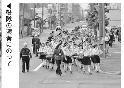
▶鼓隊の演奏にのって

市立中央小学校(大通東6)で「中央区東・苗穂・東北地区交通安全のつどい」が開催されました。交通安全標語の表彰などの後、同校児童や地域住民らは、道行く人々に交通安全を呼び掛けながら、周辺地域をパレードしました。