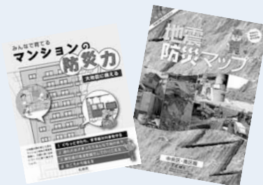
▲災害への備えや対応をまとめた「地震防災マップ（右）」と「マンションの防災力（左）」を区役所でも配布しています。

安否確認やけが人の搬送、 食料・水の確保や運搬など助 け合いが必要になります。家 族構成や緊急時の連絡先、手 助けが必要な人の把握や対応 などを日ごろから確認してお きましょう。