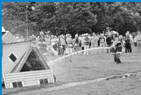
▲てっぽく・ひろばと手稲鉄北小学校体育館で手稲区防災訓練が行われ、地域住民ら約500人が参加しました (9月3日)。

人口140,514人 (前月比+34) 世帯数57,285世帯 (前月比+39) 平成25年9月1日現在