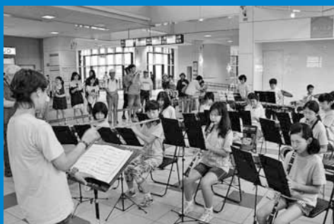
▲JR手稲駅自由通路「あいくる」で、手稲西小学校スクールバンドによるコンサート (左・8月17日) や、北海道紙芝居研究会「かせるん」による紙芝居・パネルシアターの公演 (右・9月5日) が行われ、集まった多くの観客が楽しいひとときを過ごしました。