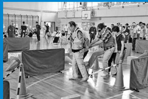
▲西宮の沢連合町内会主催の防災訓練に近隣住民が参加し、5人1組で障害物を避けながら避難所まで逃げる訓練を体験しました (8月25日)。