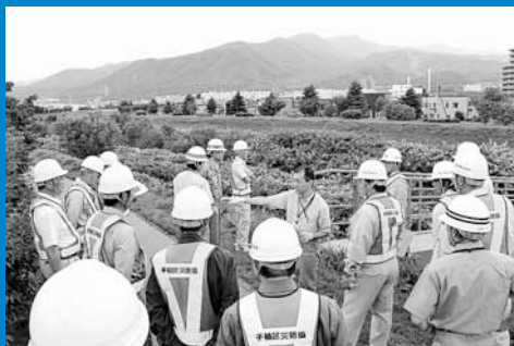
▲手稲区災害防止協会と区土木部が合同で水害対策の訓練を行い、樋門の操作方法や要注意箇所などを確認しました (8月23日)。