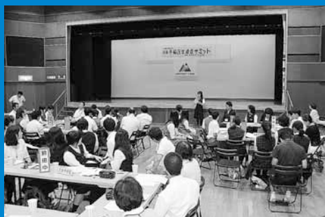
▲区民センターで「手稲区中学校生徒会サミット」が開催され、区内9校の生徒会役員が活発に意見を交わしました (8月16日)。