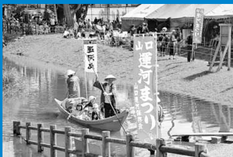
▲「手稲山口運河まつり」では運上船「運河丸」の試乗や農産物の直売などが行われ、多くの来場者でにぎわっていました (9月8日)。