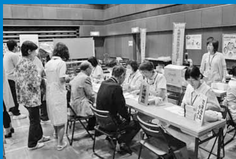
▲区健康・子ども課主催の「健康っていいねフェア」が開催され、多くの来場者が楽しみながら健康づくりについて学びました (9月7日)。