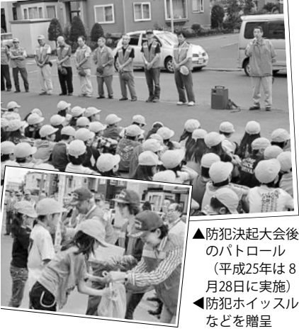
▲防犯決起大会後のパトロール（平成25年は8月28日に実施） ▲防犯ホイッスルなどを贈呈

また、毎年同会議のメンバーが集まり、防犯決起大会を開催。大会後には、青色パトロール隊がパトカーと共に地区内の小中学校を回り、防犯ホイッスルなどを子どもたちに贈っています。