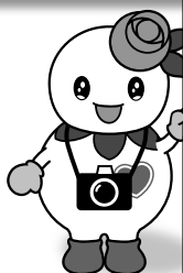
マスコットキャラクター 「しろっぴー」