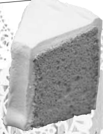
パティスリーシュゼット 塩シフォン