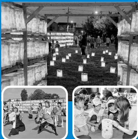
▲「第22回ていね夏あかり」がてっぽく・ひろばで開催され、会場は、1万個を超えるちようちんの明かりで幻想的な雰囲気に包まれました (7月14日)。