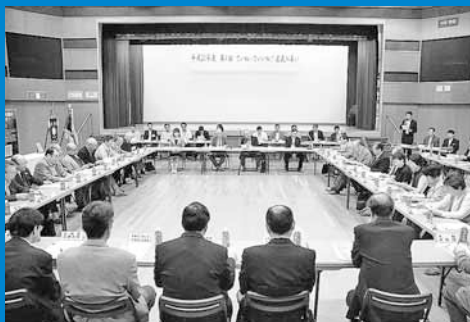
▲平成25年度第1回「ていねっていいね!区民の集い」が行われ、区内でまちづくりに携わる団体の代表が参加しました (6月27日)。