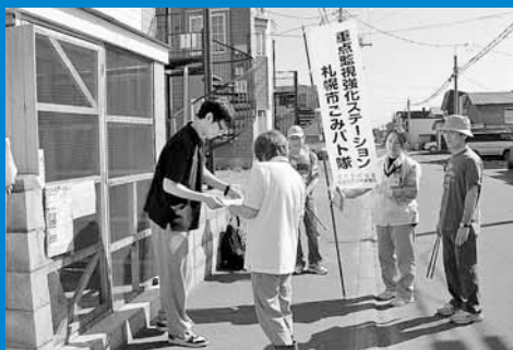
▲前田わらび北町内会と曙第22(すずかけ)町内会が、北海道工業大学の学生と「正しいごみの出し方」早朝キャンペーンを行いました (7月1日)。