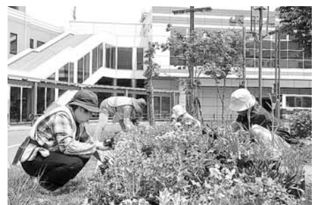
▲手稲花の会「ノンノ」による花の植え替え

JR手稲駅を訪れた際には、ぜひ、四季折々の花の美しさを楽しんでください。わり目に花を植え替えたり、雑草の抜き取りを行ったりして管理しています。