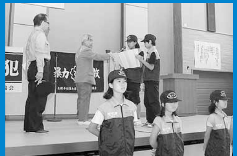
▲手稲中央連合町内会主催の「第36回安全な街づくり宣言大会」が、手稲コミュニティセンターで開催されました (7月7日)。