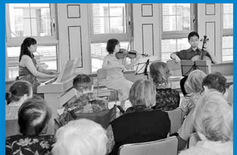
▲手稲鉄北地区の老人ホーム「ふれあいの郷」で、ミニコンサートが開催され、会場は優しい音色に包まれました (7月10日)。

編集手稲区役所総務企画課広聴係 〒006-8612 札幌市手稲区前田1条11丁目 Tel:681-2432(直通) Fax:681-6639 ホームページ「ていねっていいね」 http://www.city.sapporo.jp/teine/