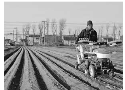
今年の春は低温が続いたため遅めの作付けでした