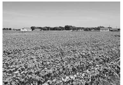
篠路のダツタンソバ畑