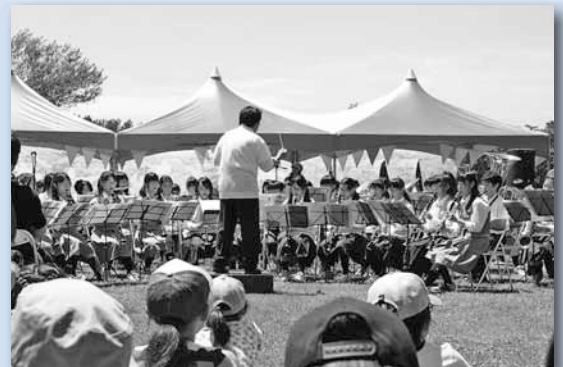
6/30 百合が原音楽祭 ～百合が原公園

編集 北区市民部総務企画課広聴係 〒001-8612 北区北24条西6丁目 ☎ 757-2503 FAX 757-2401