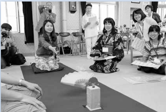
6/22 留学生日本文化交流会 ～幌北会館