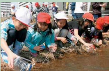
▲豊平川にサケの稚魚を放流