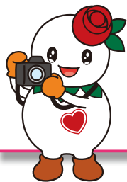
マスコットキャラクター「しろっぴー」

詳しくは、区総務企画課広聴係と区内各まちづくりセンターなどで配布中の募集チラシが区役所ホームページをご覧ください。