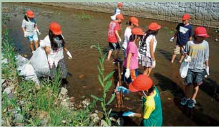
▲望月寒川で清掃活動

西白石小学校では、近くを流れる望月寒川での河川改修工事をきっかけに、4～6年生の児童が川を教材としたさまざまな環境活動に取り組んできました。望月寒川をより深く知ろうと、古地図から地域の歴史や川の流れる変化を学んだほか、ゲリラ豪雨で水位が上がる仕組みなど気象や災害について理解を深め、川を利用する際の注意点やルールを考えました。