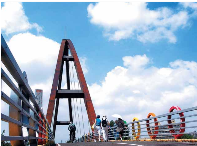
▲第4回写真コンテスト応募作品「虹の橋」 撮影場所：白石サイクリングロード・虹の橋

詳しくは、区総務企画課広聴係と区内各まちづくりセンターなどで配布中の募集チラシが区役所ホームページをご覧ください。