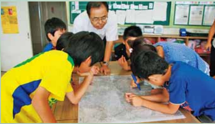
▲古地図から歴史を読み取る

区内には、川を活用した授業を行っている小学校があります。川を通して自然環境を学ぶ2校の取り組みを紹介します。