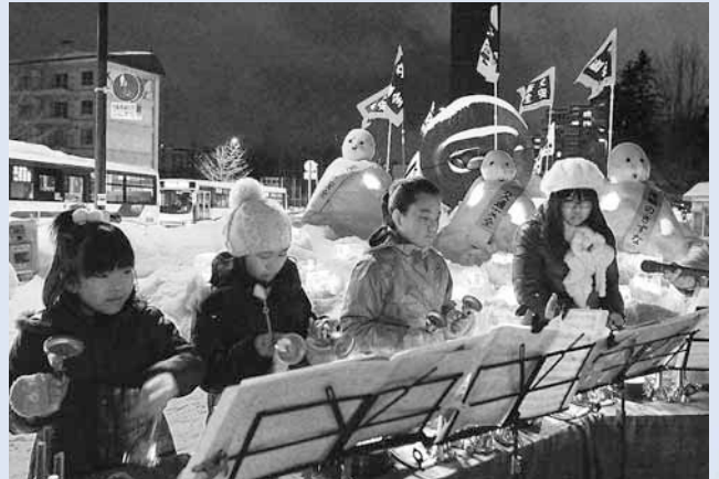
▶真駒内地区 ふれあい雪あかり