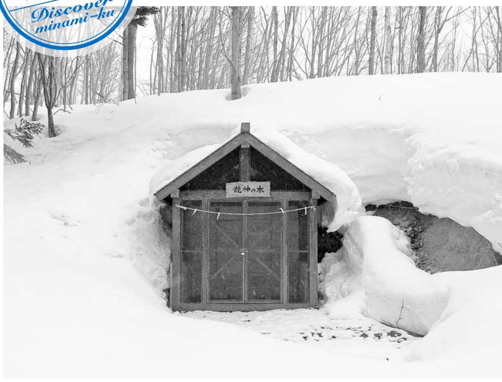
▲湧水口は不純物などを防ぐために囲われ、水はホースで水くみ場に送られています

豊滝市民の森入口付近にある盤龍山 ばんりゅうざん 信行院 しんぎょういん の境内に、豊滝「龍神の水」として地域の人々に親しまれている湧き水があります。平成24年(2012年)2月には、簾舞地区町内会連合会によって、平成23年度の簾舞地区遺産に選定されました。