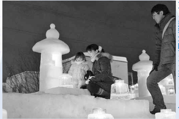
1/26 ◀藻岩地区アイスキャンドル

区内の各地区で、「雪あかり」のイベントが行われました。今年は、真駒内地区が新たに加わり、多くのアイスキャンドルやスノーキャンドルで会場が彩られました。