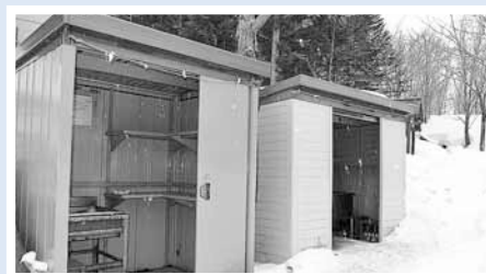
▲プレハブの水くみ場のホースからは豊富な水が湧き出ています

豊滝市民の森入口付近にある盤龍山 ばんりゅうざん 信行院 しんぎょういん の境内に、豊滝「龍神の水」として地域の人々に親しまれている湧き水があります。平成24年(2012年)2月には、簾舞地区町内会連合会によって、平成23年度の簾舞地区遺産に選定されました。