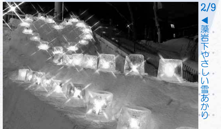
2/9 ◀藻岩下やさしい雪あかり