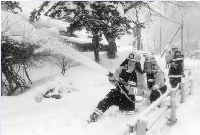
◀雪が降る中、一斉放水!

旧黒岩家住宅（旧簾舞通行屋）で、旧黒岩家住宅保存会などの地域住民や南消防団、南消防署が、文化財防火デーの一環として消防訓練を実施しました。大雪の中、参加者は初期消火活動や一斉放水など声を掛け合いながら訓練に励みました。