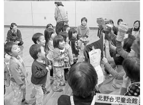
2月1日(金)・6日(水) 北野子育てまつり 区内2カ所で開催。世代を超えて、人形劇や遊びを一緒に楽しみました。