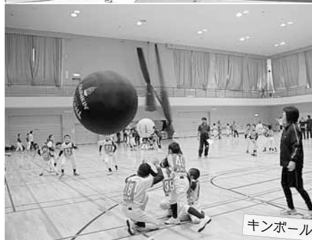
2月11日(祝) ニューススポーツフェスティバル 冬場も屋内でできる“ニューススポーツ”に挑戦! ミニゲームで汗を流しました。