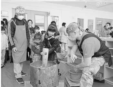
2月3日(日) アートステージ・遊びの広場 雪の滑り台や餅つきなど遊びのコーナーが盛りだくさん! 地域の交流を深めました。