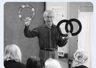
病院で患者さんに手品を披露

マジック同好会に所属していて、仲間と一緒に老人福祉施設などで手品を披露しています。誰かに見てもらい、喜んでもらえればと手品のボランティアを始めましたが、行った先で目を輝かせて手品を見てくれたり、「ありがとう」「また来てね」と声を掛けられるのが何よりもうれしく、今後もうずっと続けていきたいです。