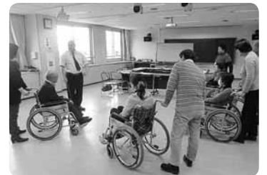
ボランティア研修の様子。実際に車を押して移動する実技に挑戦!

具体的な内容などが決まっていなくても、ボランティアに興味があるという方は一度ご相談ください。いきなり実践するのは不安という方には、ボランティア研修センターが用意している研修プログラムなどもご案内します。ボランティア活動のための基礎知識から実践的な技術習得まで、目的に合わせて選んでいただけます。