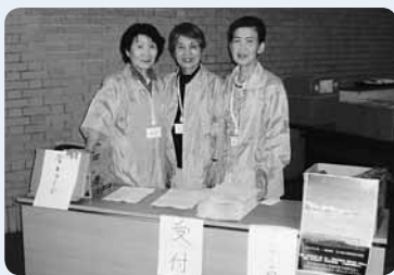
サークルの仲間と国際フォーラムのお手伝い

もう25年以上「つきさむ62」というボランティアサークルに所属し、リサイクル品のバザーやお祭りの手伝い、病院の患者さん用に工夫したパジャマや帽子の作製など、さまざまな活動を行ってきました。長く続けていますが、ボランティアで嫌な思いをしたことは一度もありません。募金活動で街頭に立ったときも、初めて募金をする高校生や「日本に恩返しをしたい」と言ってくれるタイの留学生に出会い、世代や国籍を越えて、気持ちのつながりを感じることができました。