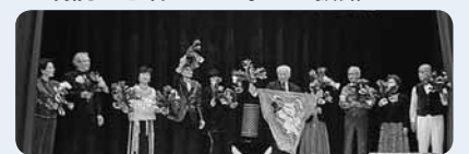
一緒に腕を磨くマジック同好会の仲間

近所のごみを拾ったり、観光地でカメラを手にしている人に「写真撮りますか?」と声を掛けるところからでもいいと思います。何かしたいという気持ちが大事です。