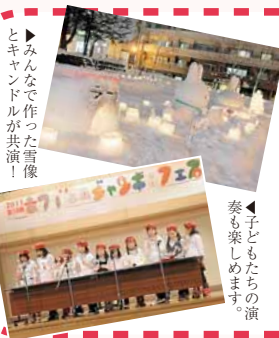
▶みんなで作った雪像とアイスキャンドルが共演！