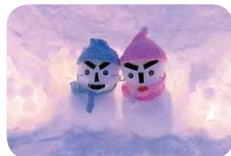
▲柔らかな光がまちを照らします。