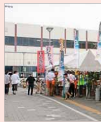
この地区では、夏に地下鉄駅前前で七夕まつりが行われます。