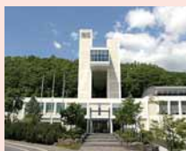
札幌○○○大学芸術の森キャンパスにはデザイン学部があります。