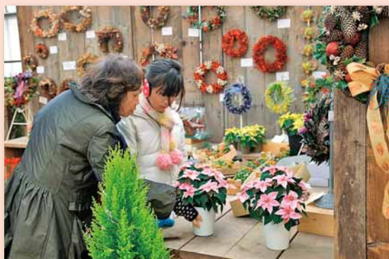
11/25 クリスマスディスプレイ展 ～百合が原公園

皆さんからご応募いただいた作品を掲載しています。 詳細などは、総務企画課広聴係までお問い合わせいた るか、北区ホームページ「みてきて北区」をご覧ください。