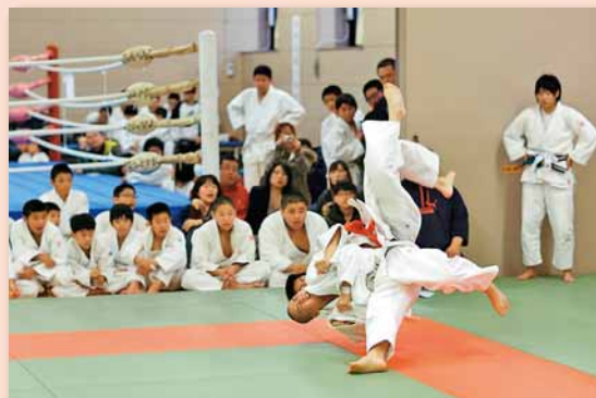
12/9 北区長杯争奪少年少女柔道交歓大会 ～北区体育館

北区 HP 「みてきて北区」 ◆ http://www.city.sapporo.jp/kitaku/ Eメール ◆ ki.somu@city.sapporo.jp