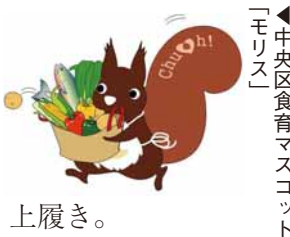
中央区食育マスコット「モリス」