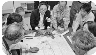
地域の課題を話し合い地図に示して「除雪マップ」を作製する、太平百合が原地区の4町内会の皆さん

満足度の高い雪対策の実現に向けて、地域ごとの課題解決のため市民参加の下で、地域懇談会など各種取り組みを行っています。