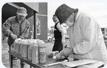
ラベルを貼る屯田老人クラブの皆さん

老人クラブや連合町内会などでも、滑り止め砂入りペットボトルの製作に協力しています。厳しい冬を少しでも快適にと、多くの方々が奮闘しています。みなさんも、できることから始めてみませんか？