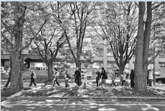
10/19 幌北ウォーキング大会 ～北大構内