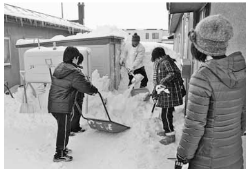
あっという間に雪山を片付ける生徒たち