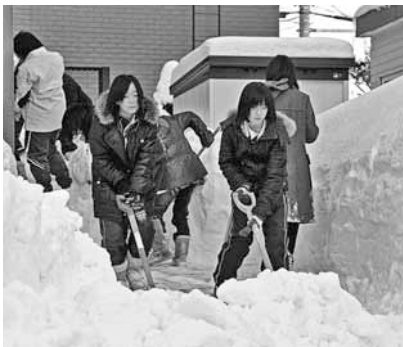
雪出し作業も力を合わせて

雪出し作業も力を合わせて 「僕たちでも大変な作業でしたから、高齢者の方はもっと大変な思いをされていたのでは」「仲間たちと一緒に地域の役に立ててうれいのです」と話す生徒たちからは、充実感が溢れていました。