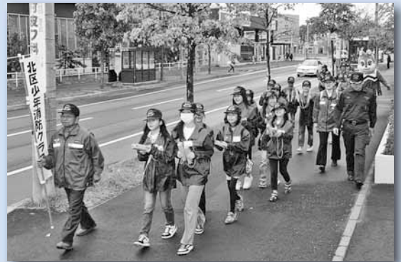
10/20 北区少年消防クラブ街頭防火啓発 ～イトーヨーカドー屯田店周辺

北区 HP 「みてきて北区」 ◆ http://www.city.sapporo.jp/kitaku/ Eメール ◆ ki.somu@city.sapporo.jp