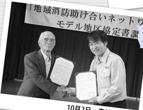
10月2日 森林公園会館

防火、防災、救命などに関するさまざまな取り組みを地域ぐるみで行い、火災のない安全で安心なまちづくりを進めるため、森林公園町内会が単位町内会としては初めて、モデル地区に指定され、厚別消防署と協定を結びました。