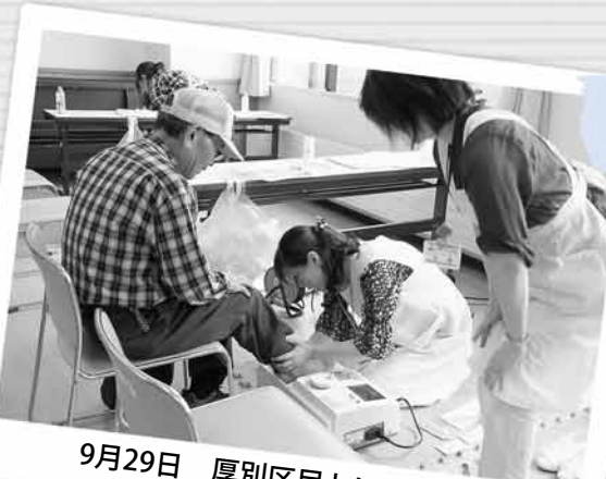
9月29日 厚別区民センター (骨密度測定)