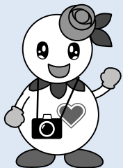
マスコットキャラクター 「しろっぴー」

「笑顔になる白石」をテーマに応募いただいた作品を、一堂に展示します。ぜひご覧ください。