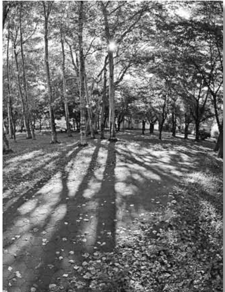
▲ 第3回写真コンテスト応募作品「木漏れ日の小径」 撮影場所：白石公園