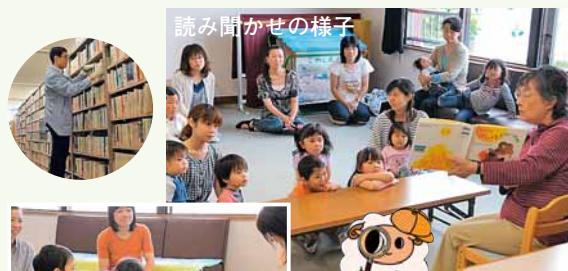
読み聞かせの様子