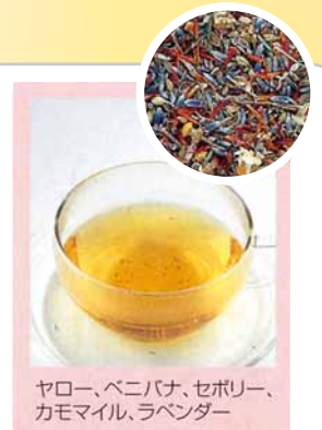
ヤロー、ペニバナ、セボリー、カモマイル、ラベンダー