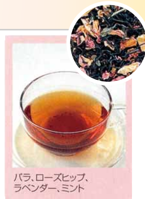
バラ、ローズヒップ、ラベンダー、ミント

1人分のティーを入れる場合、ドライハーブであれば小さじ1杯、フレッシュハーブであれば小さじ3杯分を用意します。陶器や耐熱ガラスのポットにハーブを入れて熱湯を注ぎ、香りを逃がさないようにふたをして2~3分蒸らし、カップに注ぎます。好みによって砂糖や蜂蜜を加えましょう。