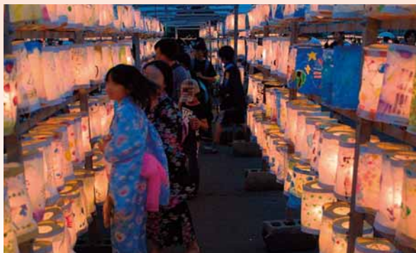
▲柔らかなあかりに包まれて、次第に癒やされていきます