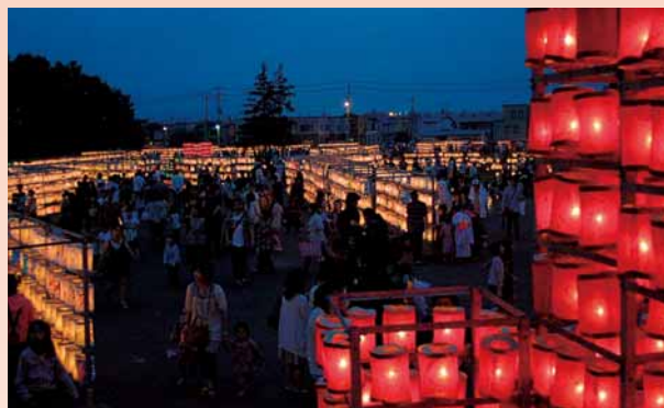
▲手作りのちょうちんが会場を埋め尽くします

ちょうちんの数も1万個を超えて、手稲区を代表するお祭りへと成長。今や夏の風物詩として区民に親しまれています。そのちょうちんのあかりが創る幻想的な風景は、手稲区内外から高く評価されており、国土交通大臣「まちづくり功労者」表彰をはじめ数々の賞を受賞しています。