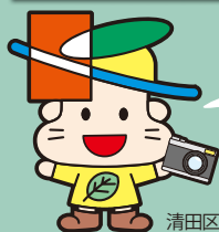
清田区マスコットキャラクター きよっち

春から夏にかけての作品をご紹介します。 区ホームページでは、皆さんからお寄せいただいた全作品を掲載しています。