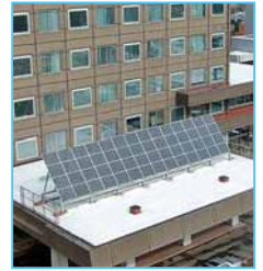
◀ 市役所本庁舎の太陽光パネル

そして、一人一人が 省エネ に取り組むことが大切なんだ。自分だけでは効果が少ないように思えるかもしれないけど、家族で、学校で、そして日本中・世界中で実行すれば大きな効果が得られるよ。