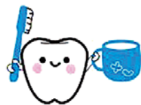
はみがきのときは水をだしっぱなしにせずコップに

ものをつくるにも、ごみのしよりににもたくさんのエネルギーや水がひつようだよ。たべものをのこさないこと、リサイクルをしてごみをへらすこと、これも地球にやさしいことなんだ。