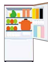
れいぞうこのあけしめをへらし、ものをためこまない

でんきをつかひすぎると、地球の元気がなくなっちゃう! でんきのむだづかいにきをつけて、たいせつにつかおうね!