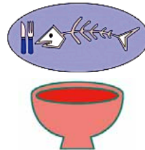
ごはんをのこさずたべる。ごみをへらす