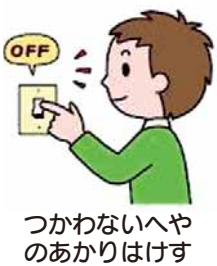
つかわないへやのあかりはけす