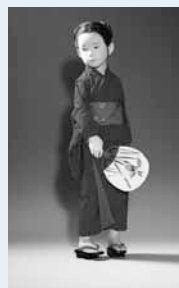
あたえ 勇輝「かきつばた」(1997年) →

神仏の像、人形、フィギュアなどの立体造形や彫刻芸術の展覧会。作品に込められた思いなどを紹介します。