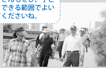
見回り活動をするメンバーの皆さん