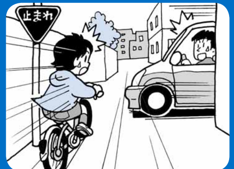
自転車に乗るときは、かならずヘルメットをかぶり、交通ルールを守ろう！