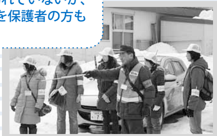
スクールガードと通学路の危険箇所を確認