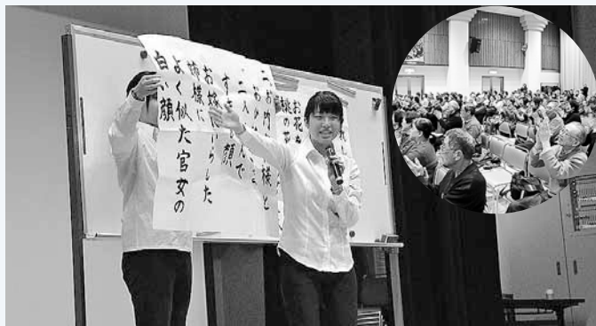
↑今年3月に行われた「健康づくりフェスティバル」 札幌大谷大学の学生たちによる「音楽療法」コーナー。