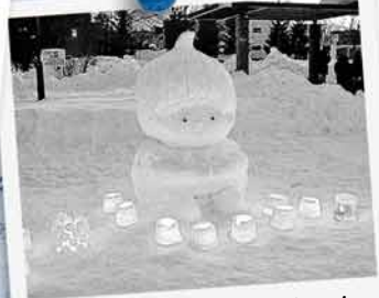
かわいい雪像になりました。キャンドルもきれい！