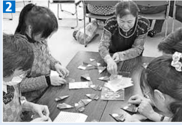
①②ふれあい喫茶の様子（平成23年12月）

ふしこふれあい喫茶 開催日 毎月第4月曜日 時間 夏季13時30分～16時 冬季13時30分～15時30分 場所 ふしこ地区センター (東区伏古11条3丁目) 会費 100円 (お菓子とお茶代)