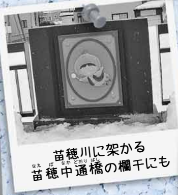
苗穂川に架かる苗穂中通橋の欄干にも