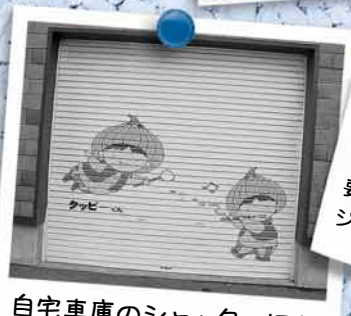
自宅車庫のシャッターにもタッピーが！