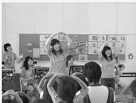
↑「北光ピカピカ子育てフェア」に参加した札幌大谷大学・短期大学部の学生たち。