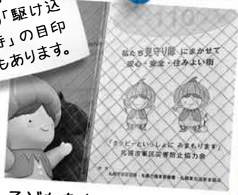
子どもたちの安全を見守る「こども110ばん」