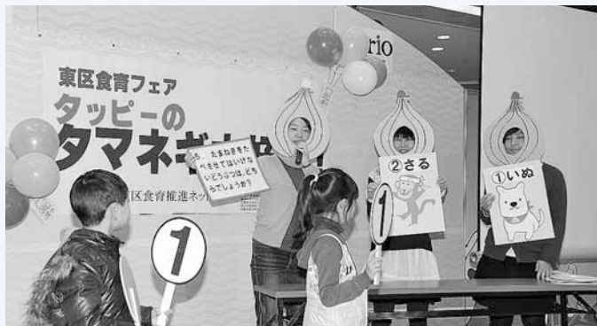
↑昨年12月の「食育フェア」の様子。 天使大学の学生たちによるタマネギクイズ。