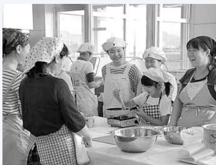
↑「たまねぎフェスタ」で開催された天使大学の学生たちによる料理教室。