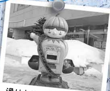
滑り止めの砂袋を入れる箱もタッピーです！