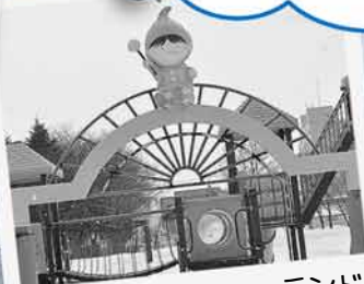
伏古公園のタッピーランドでは、みんなをお出迎え