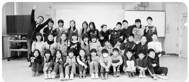
ねん くみ ともだち せんせい 5年1組のお友達と先生

わたし さくひん だいいい 私の作品の題名は、「イルカの大ジャンプ」です。工夫したところは、土台をビーチボールにしたところと、イルカがフラフープに通るようにしたところと、バランスをとったり、イルカなどをつるしたりするのが難しかったけれど、作るのはとても楽しかったです。