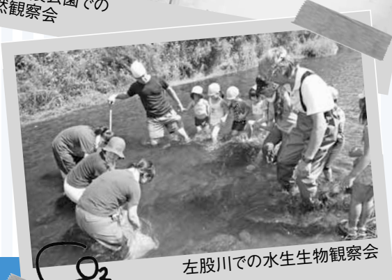
左股川での水生生物観察会

西区では、三角山や琴似発寒川をはじめとする豊かな自然のもと、環境に配慮したまちづくりを進めています。今月は、さまざまな取り組みや催しの一部をご紹介します。皆さんも、一緒に地球の未来のためにできることを考えてみませんか?