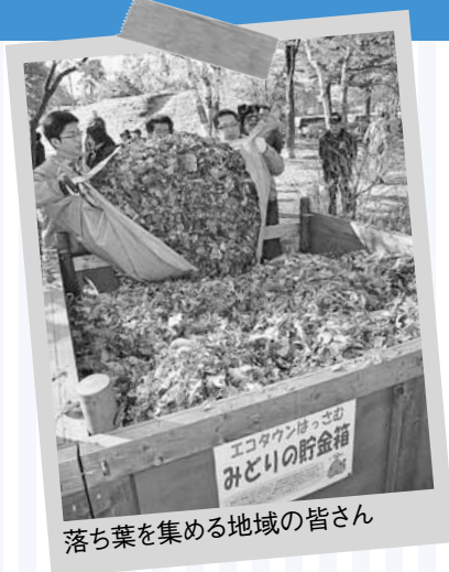
落ち葉を集める地域の皆さん