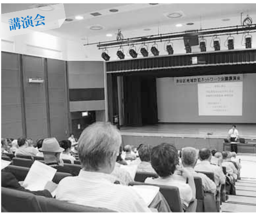
講演会 平成23年度のテーマは「子どもの安全」。区民約200人が、実践報告に真剣に聞き入っていました。

主な活動として、区民を対象とした講演会を毎年開催しています。豊平警察署が犯罪の発生状況や防犯のための心得について講話するほか、地域防犯の向上に役立つ身近な内容が盛り込まれています。本年度は、学校とPTA、地域が一体となって取り組んだ校区安全マップ作りの実践事例が紹介されました。