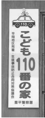
玄関先の黄色のプレートが目印！

地域ぐるみで子どもたちを守るボランティア活動です。子どもが被害に遭ったり、危険を感じて助けを必要とした際に、緊急避難場所として一時的な保護や警察への連絡などを行います。清田区でも多数の一般家庭や商店などが参加。活動に参加する家の玄関や店の入り口には、黄色のプレートが掲げられています。