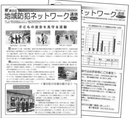
清田区地域防犯ネットワーク通信 区役所(2階18番窓口、1階正面ロビー)で配布しています。

年度末には全体会議を開催。一年間の活動内容と成果を振り返ります。これらの活動や防犯情報を共有するために情報誌を定期発行しているほか、区内の行事で啓発活動を行うなど、さまざまな活動に取り組んでいます。