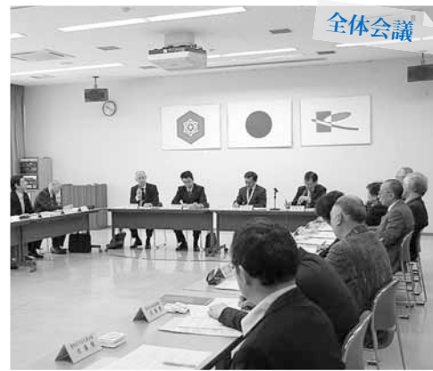
全体会議 各団体が会し、翌年以降のさらなる活動の充実に向けて、活発な意見交換が行われました。