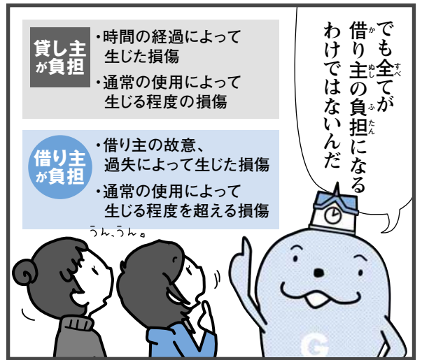
※国土交通省「原状回復をめぐるトラブルとガイドライン」による