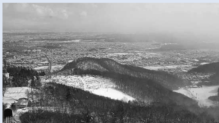
山頂展望台から見た澄川・真駒内方面の景色

平成22年4月から再整備のため休止していた「もいわ山ロープウェイ」がリニューアルオープンし、もいわ山麓駅でオープニングセレモニーが行われました。ロープウェイのリニューアルを待ちわびた大勢の市民が集まり、山頂展望台やゴンドラから眼下に広がる市街地などの眺めを楽しみました。