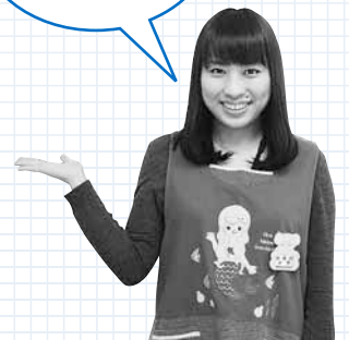
南保健センター なかの 中野保健師