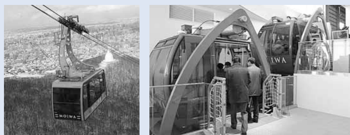
山麓駅から中腹駅までを結ぶロープウェイ（写真左）と中腹駅と山頂駅を結ぶ「もーりすカー」（同右）