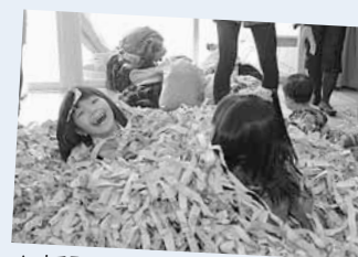
▲新聞紙ふわふわだね〜