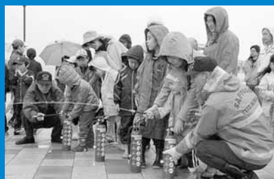
▲明日風公園で防災訓練が行われ、約50人が参加しました (10月22日)。