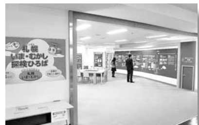
▲札幌いま・むかし探検ひろば

当日は、利尻や稚内からの直送品の『産直市』(午前11時30分～)やロビーコンサート(午後1時～)なども行います。ぜひ、この機会に丘珠空港へ足を運んでみませんか?