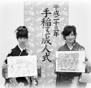
▲ 昨年の成人式の様子