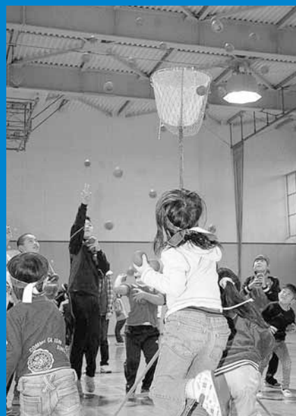
▲稲穂金山スポーツレクリエーションが稲穂小学校で開催されました (10月23日)。