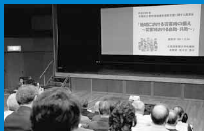
▲災害時要援護者避難支援に関する講演会が区民センターで行われました (10月24日)。