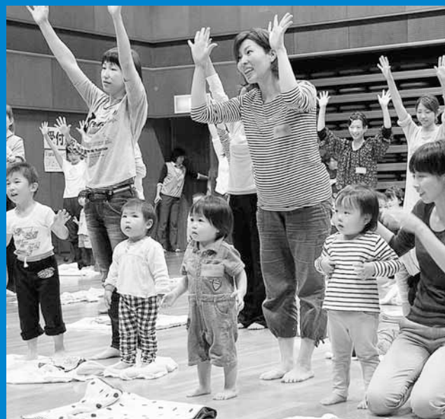
▲音楽に合わせて体を動かす親子deビクスが区民センターであり、2日間で約90組の親子が参加しました (10月24日、27日)。

編集手稲区役所総務企画課広聴係 〒006-8612 札幌市手稲区前田1条11丁目 Tel:681-2400 (内線224) Fax:681-6639 ホームページ「ていねっていいね」 http://www.city.sapporo.jp/teine/