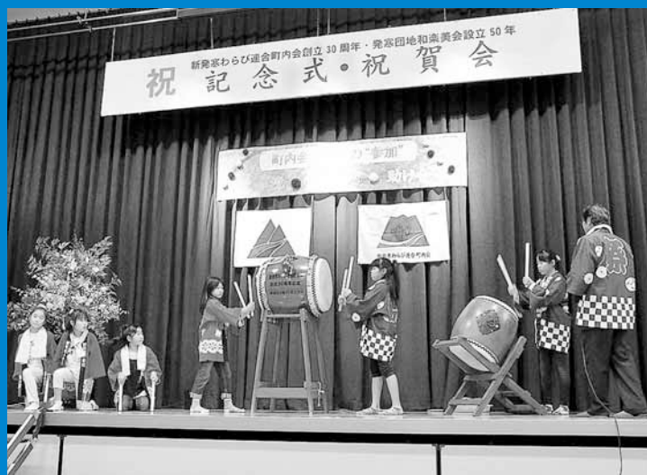
▲新発寒わらび連合町内会創立30周年と発寒団地和楽委員会設立50周年を記念した式典が、新発寒地区センターで行われました (10月23日)。