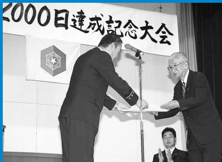
▲手稲区は10月30日に焼死者火災ゼロ連続2000日を達成。手稲中学校で記念大会が開催され、関係団体へ感謝状などが贈呈されました (10月30日)。

人口140,118人 (前月比+33) 世帯数56,000世帯 (前月比+66) 平成23年11月1日現在 ※今月から国勢調査の確定値を掲載